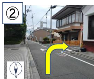
1つ目のT字路を右折