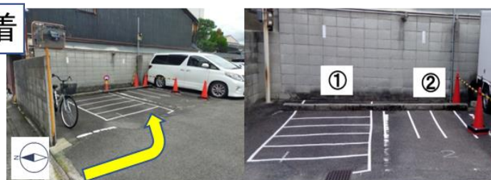
左側白線内 ①②番ファイブM契約スペースが第二駐輪場