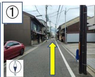
西陣校から南へ約30m