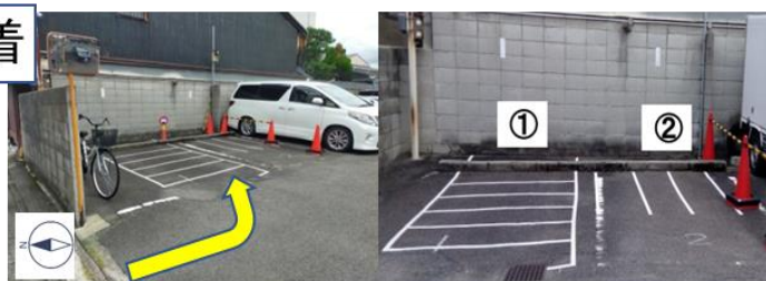
左側白線内 ①②番ファイブM契約スペースが第二駐輪場